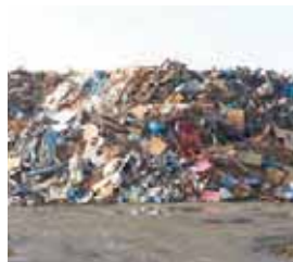
2011.11 仮置場の様子 (岩手県宮古市)