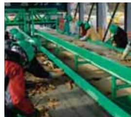
2011.12 災害廃棄物の手選別の様子 (宮城県女川町)