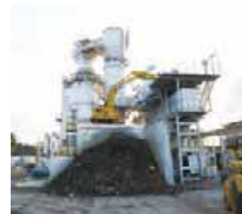
2011.12 設置された仮設焼却炉 (宮城県仙台市)