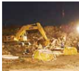
2011.12 夜間作業の様子 (宮城県石巻市)