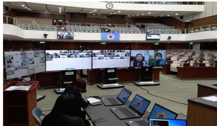
オンライン議会の様子